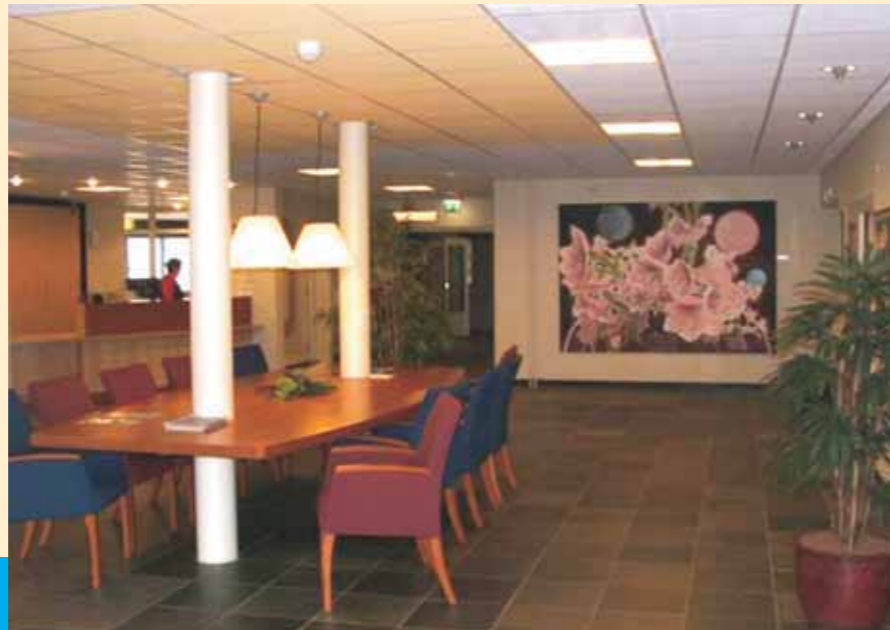
De centrale hal, met de leestafel, is bedoeld als ontmoetingsplek.

Voor gasten van onze cliënten hebben we een tweetal logeerkamers in de verhuur; méér hierover vindt u in onze brochure hotelmatige dienstverlening . De post wordt dagelijks aan uw appartement bezorgd door onze medewerkers. Als extra service hangt er in de centrale hal een brievenbus voor uw uitgaande post.