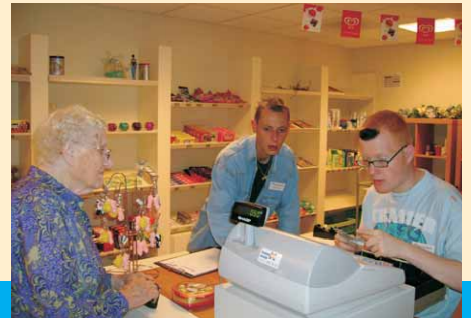
De Toko in de centrale hal.

Verhuizen naar een zorgcentrum is een grote stap. Wij zullen ons best doen om er voor te zorgen dat u zich bij ons thuis voelt. Want... wonen is meer... dan alleen een dak boven uw hoofd!