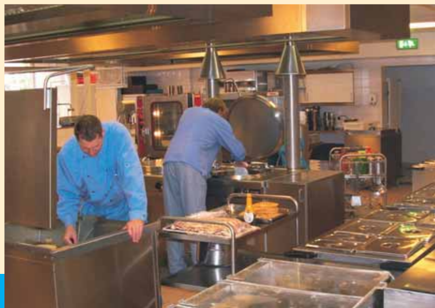
In de moderne keuken wordt rekening gehouden met dieet- en andere wensen.

Bovendien is er de mogelijkheid om uw maaltijd gezamenlijk met andere cliënten en 55-plussers uit de directe omgeving te gebruiken in het restaurant. Ook uw gasten zijn hier welkom; wel moet u dat vooraf reserveren aan de balie.