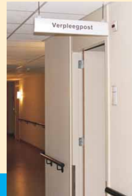
De medewerkers op de verpleegpost coördineren de zorg binnen Maarsheerd.

Hebt u een huisarts van buiten de regio dan adviseren wij u in overleg met uw huisarts eventueel over te stappen naar een huisarts in Stadskanaal.